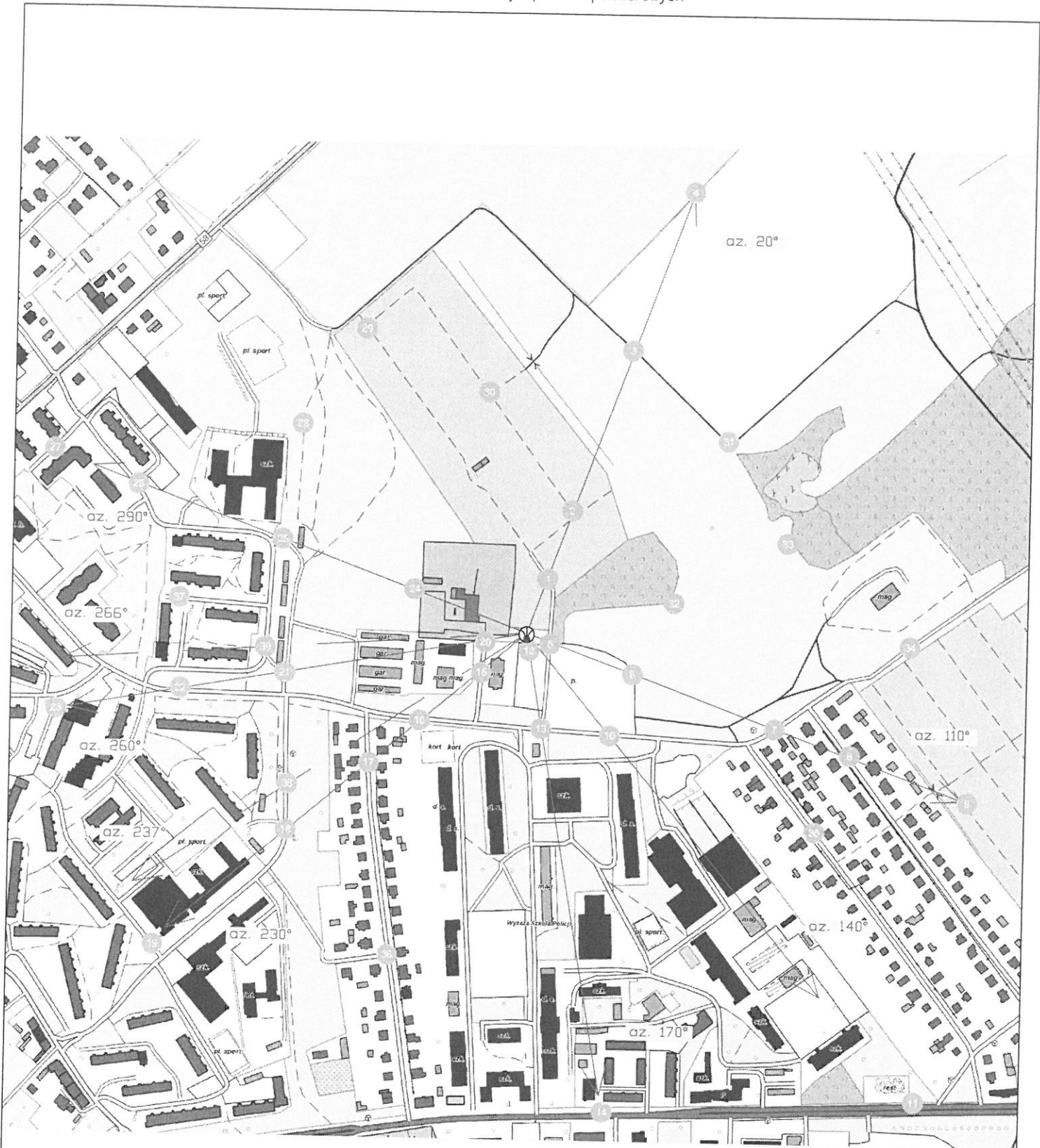
Rys.1 Lokalizacja pionów pomiarowych