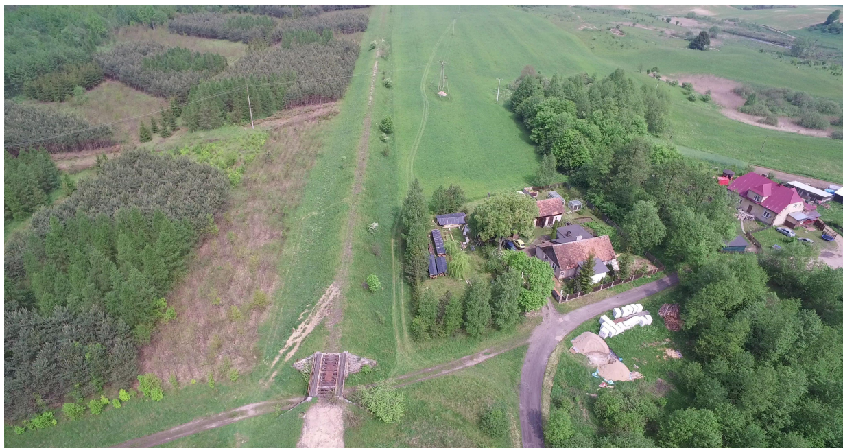
Zdj. nr 7 – przebieg ścieżki rowerowej – km ok. 7+980 – lokalizacja MOR (strona prawa)