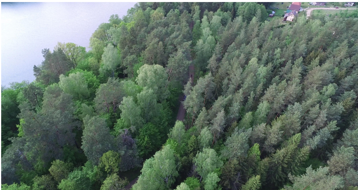
Zdj. nr 30 – widok na pętlę Łęsk na km Ok. 4+650 (zdjęcie zorientowane przeciwnie do pikietażu na rysunkach PFU; widoczne jezioro Łęsk).