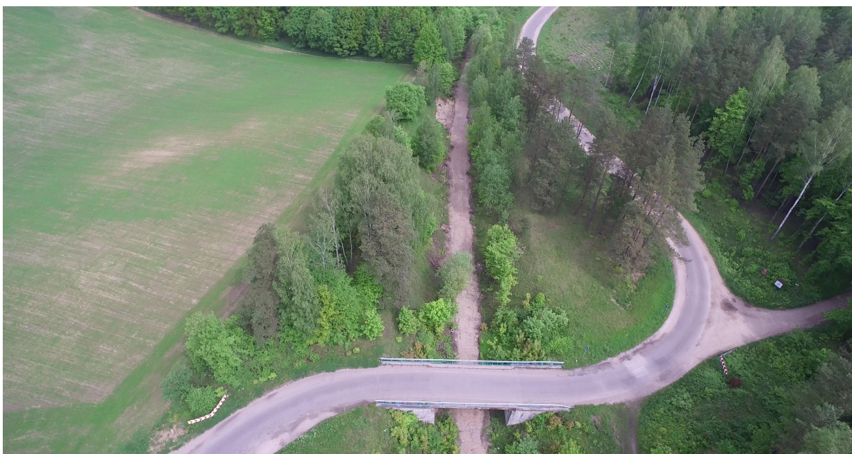
Zdj. nr 10 – przebieg ścieżki rowerowej – km 0k. 11+600 – połączenie trasy z początkiem istniejącej pętli „Łęsk” (w prawą stronę)