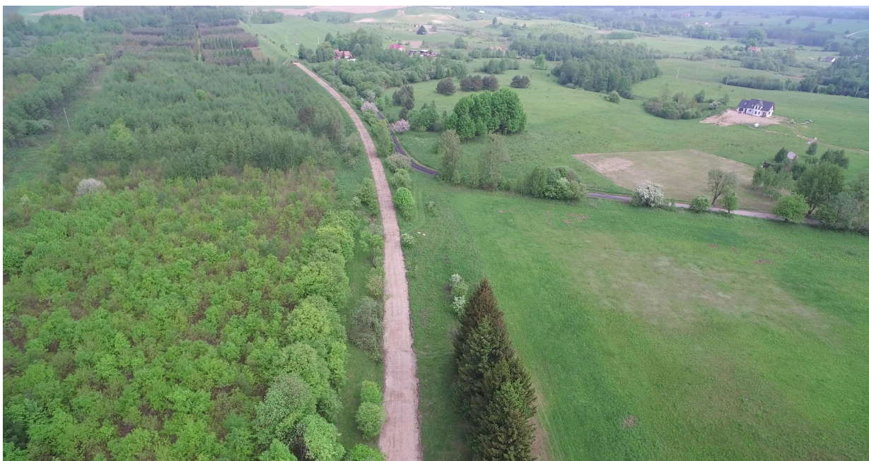
Zdj. nr 6 – przebieg ścieżki rowerowej – km ok. 7+630 – połączenie planowanej trasy z końcem istniejącej pętli „Wałpusz” (z prawej strony)