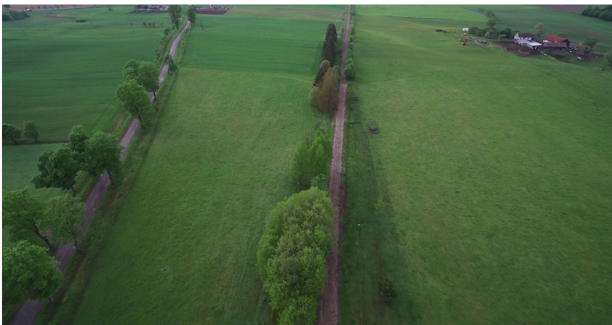
Zdj. nr 13 – przebieg ścieżki rowerowej – km 0k. 18+000.