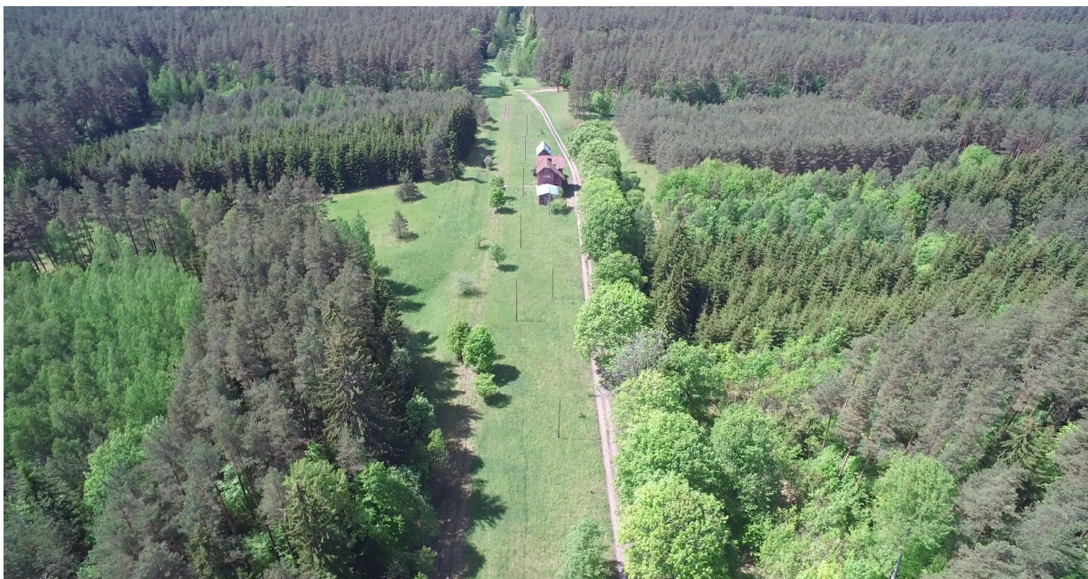
Zdj. nr 23 – przebieg ścieżki rowerowej – km ok. 32+400 – koniec toru dreźny, koniec pętli „Łąki Dymerskie”