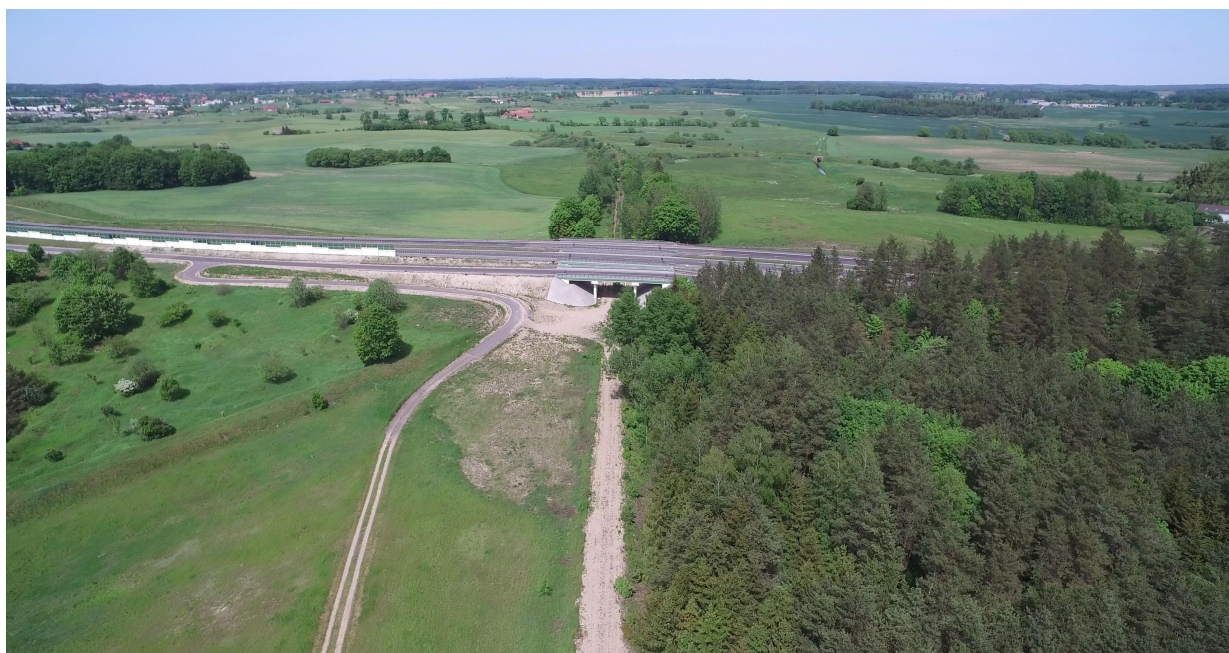
Zdj. nr 27 – przebieg ścieżki rowerowej – km 0k. 40+115.- koniec podstawowego odcinka ścieżki; połączenie ścieżki z odcinkiem planowanego ciągu pieszo – rowerowego z kostki bet.