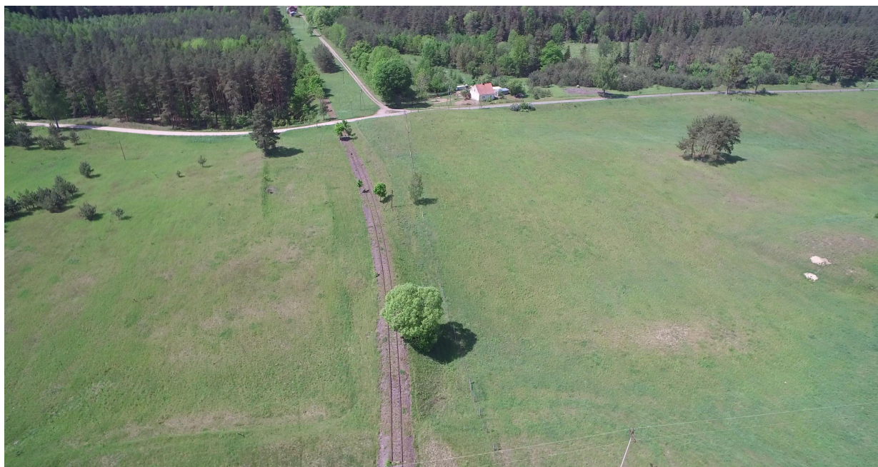
Zdj. nr 22 – przebieg ścieżki rowerowej (torem drezynowym) – km 0k. 32+050 – od lewej strony ścieżka łączy się z pętlą „Łąki Dymerskie”.