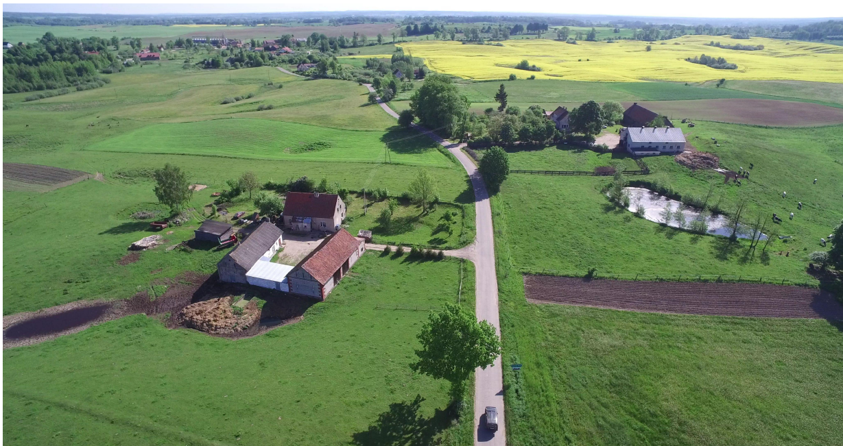
Zdj. nr 32 – początkowy odcinek pętli – km ok. 0+300.