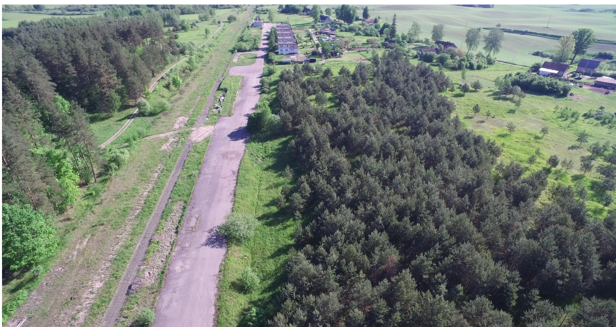
Zdj. nr 17 – przebieg ścieżki rowerowej – km ok. 24+940 – zjazd w jedną z odnóg planowanej trasy, w kierunku jeziora Szczepankowskiego (dł. odnogi ok. 800 metrów).