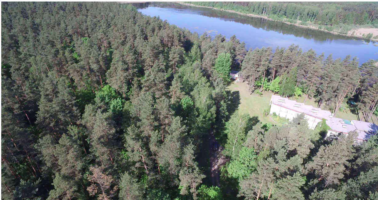
Zdj. nr 31 – koniec odcinka odnogi prowadzącej do jez. Szczepankowskiego (km ok. 0+850).