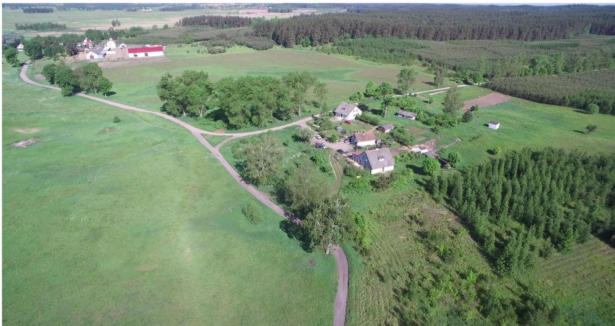
Zdj. nr 33 – przebieg pętli „Łąki Dymerskie” – km ok. 3+700.