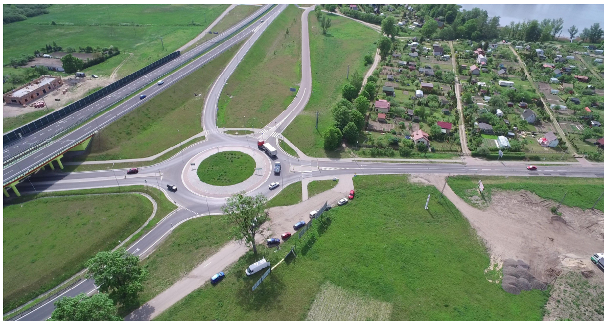
Zdj. nr 28 – przebieg ścieżki rowerowej na odcinku ciągu pieszo - rowerowego do Biskupca – km 0k. 1+300 – w oddali widoczne jezioro Kraksy Małe, gdzie zlokalizowany jest koniec opracowania.