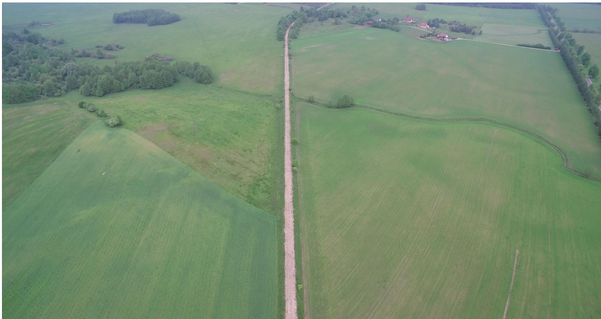
Zdj. nr 5 – przebieg ścieżki rowerowej – km ok. 6+000.