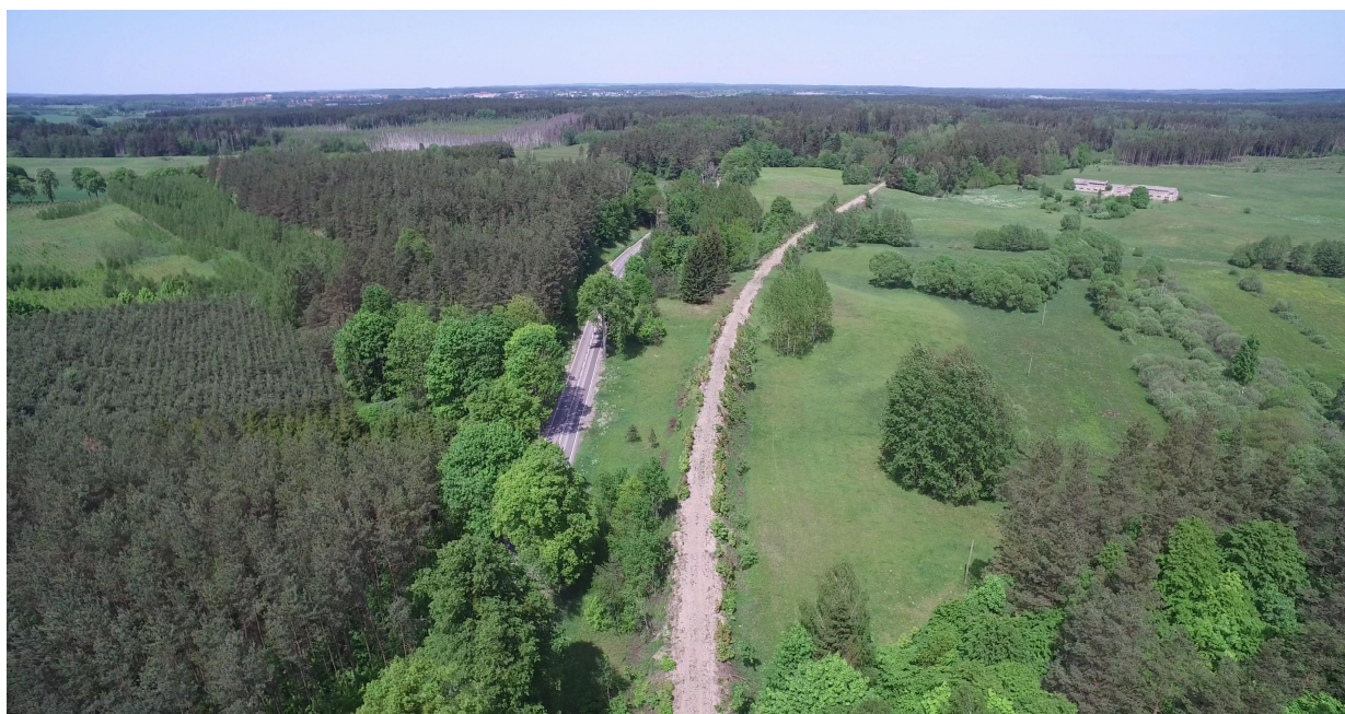
Zdj. nr 25 – przebieg ścieżki rowerowej – km 0k. 37+500 – lokalizacja nowych obiektów: MOR-u oraz wieży widokowej po prawej stronie ścieżki