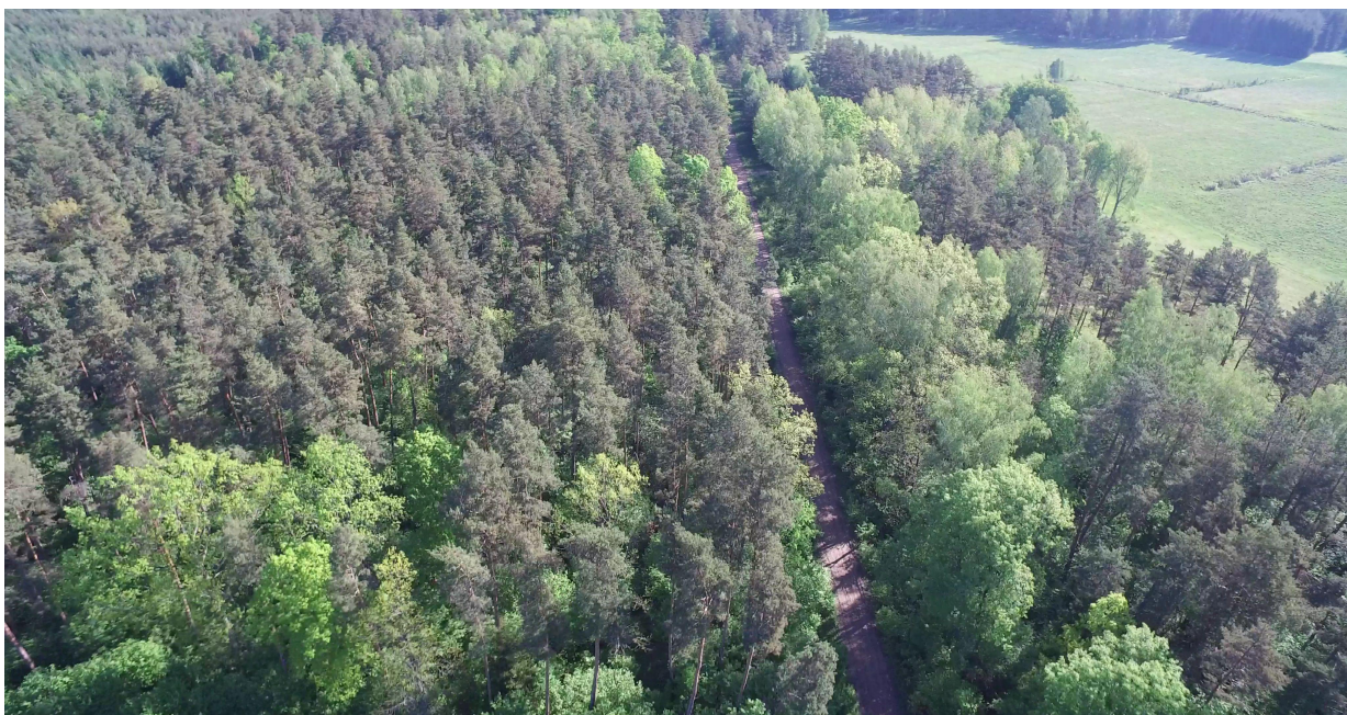
Zdj. nr 16 – przebieg ścieżki rowerowej – km 0k. 24+000.