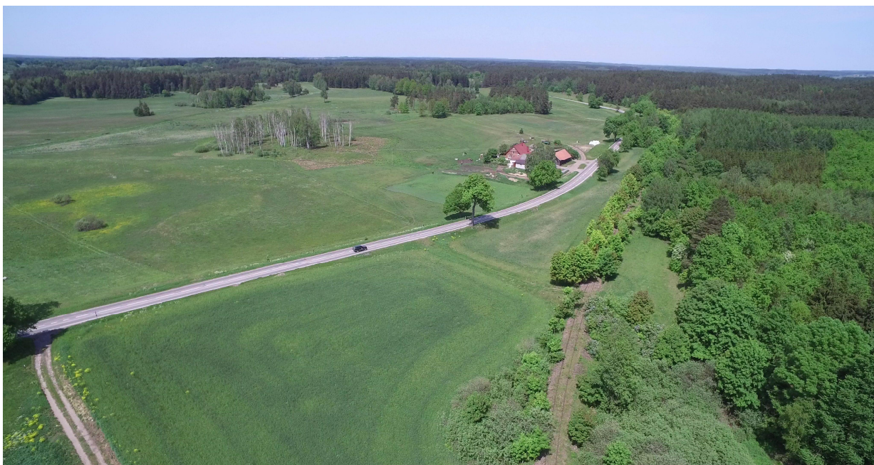
Zdj. nr 24 – przebieg ścieżki rowerowej – km ok. 35+000.