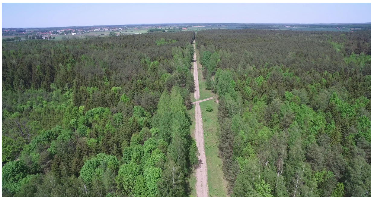
Zdj. nr 26 – przebieg ścieżki rowerowej – km 0k. 39+000.