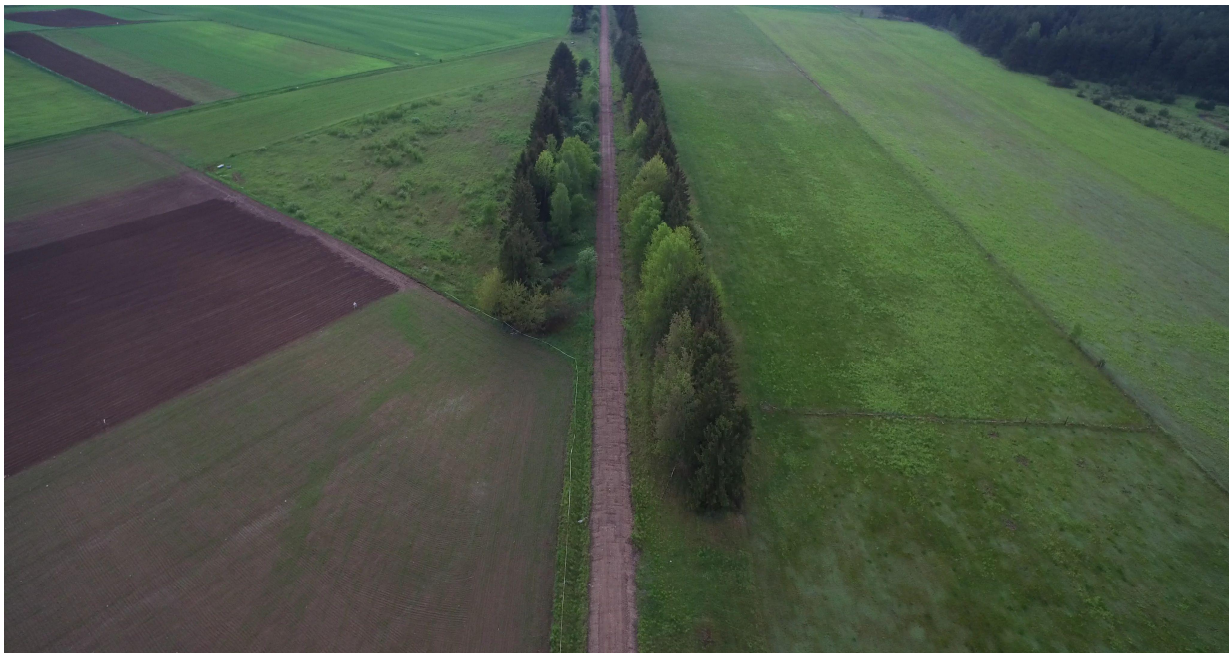
Zdj. nr 12 – przebieg ścieżki rowerowej – km 0k. 16+000.