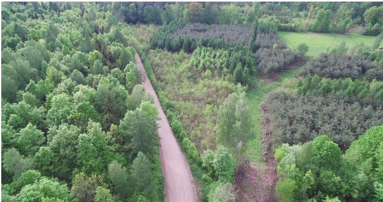
Zdj. nr 29 – widok na pętlę Łęsk na km Ok. 1+500 (zdjęcie zorientowane przeciwnie do pikietażu na rysunkach PFU)