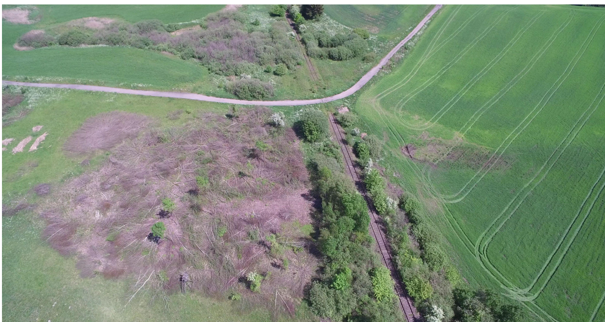
Zdj. nr 20 – przebieg ścieżki rowerowej – km 0k. 29+800 – przecięcie trasy linii drezynowej z pętlą „Łąki Dymerskie” (kier. pętli od prawej do lewej)