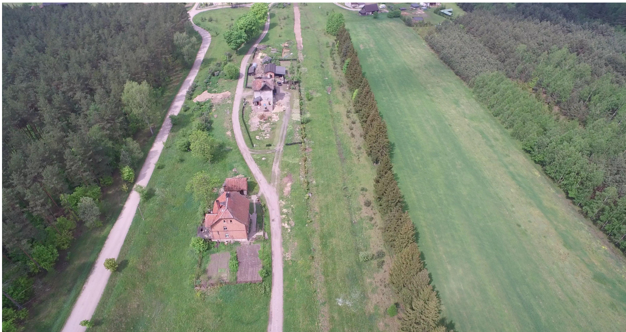
Zdj. nr 11 – przebieg ścieżki rowerowej – km 0k. 14+000.