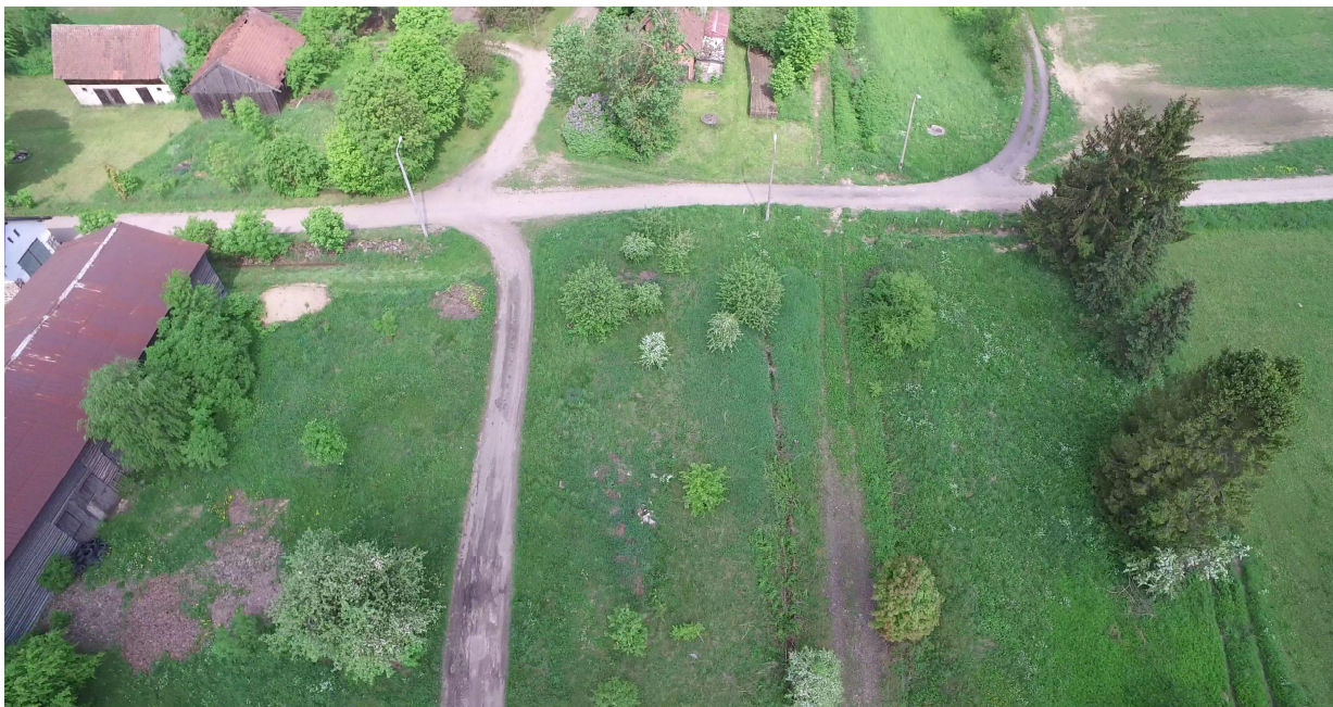
Zdj. nr 9 – przebieg ścieżki rowerowej – odcinek przebiegający przez m. Nowe Kiejkuty (km 0k. 10+000)