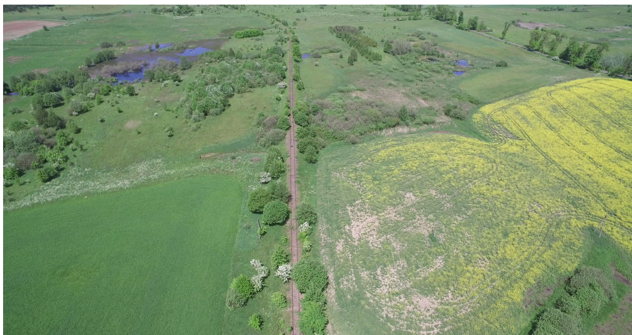
Zdj. nr 21 – przebieg ścieżki rowerowej (torem drezynowym) – km 0k. 31+120 – granica gmin Dźwierzuty i Biskupiec.