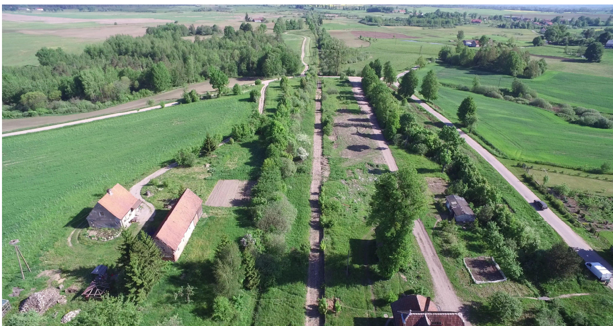
Zdj. nr 19 – przebieg ścieżki rowerowej – km 0k. 28+170 – lokalizacja MOR po prawej stronie; w oddali widoczny początek pętli „Łąki Dymerskie” (w prawą stronę) oraz początek czynnej linii drezynowej kolejowej (prosto), która będzie jednym ze sposobów pokonania kolejnego odcinka planowanej trasy. Drugą możliwością będzie przejazd pętlą „Łąk Dymerskich” do miejsca zakończenia linii drezynowej.