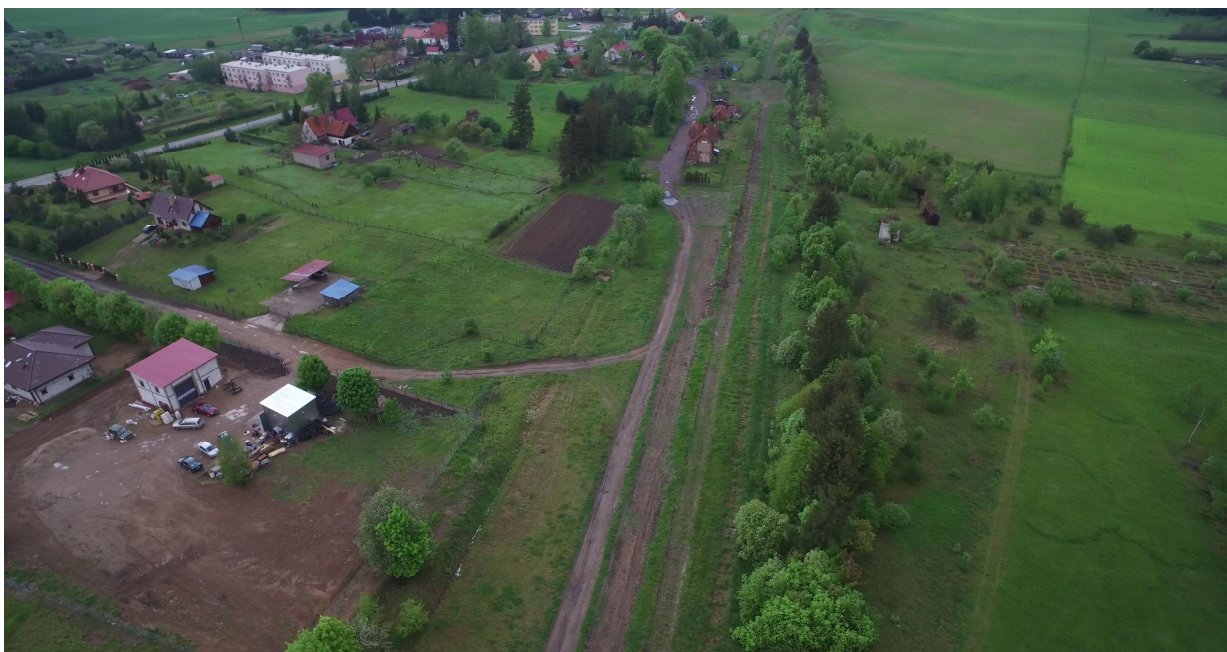
Zdj. nr 14 – przebieg ścieżki rowerowej – km 0k. 19+300 – lokalizacja MOR po stronie prawej.