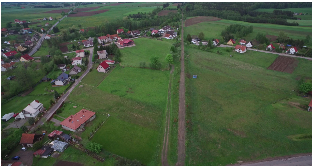
Zdj. nr 15 – przebieg ścieżki rowerowej na terenie m. Dźwierzuty – km 0k. 20+400.