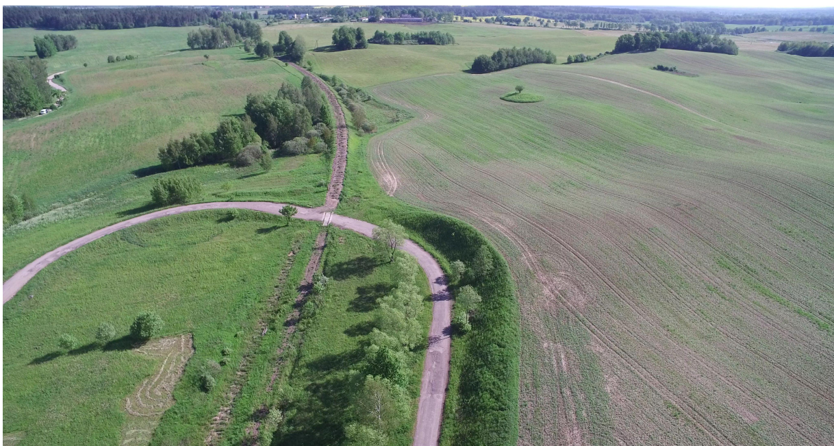
Zdj. nr 18 – przebieg ścieżki rowerowej – km ok. 25+950 – lokalizacja wieży widokowej po prawej stronie.