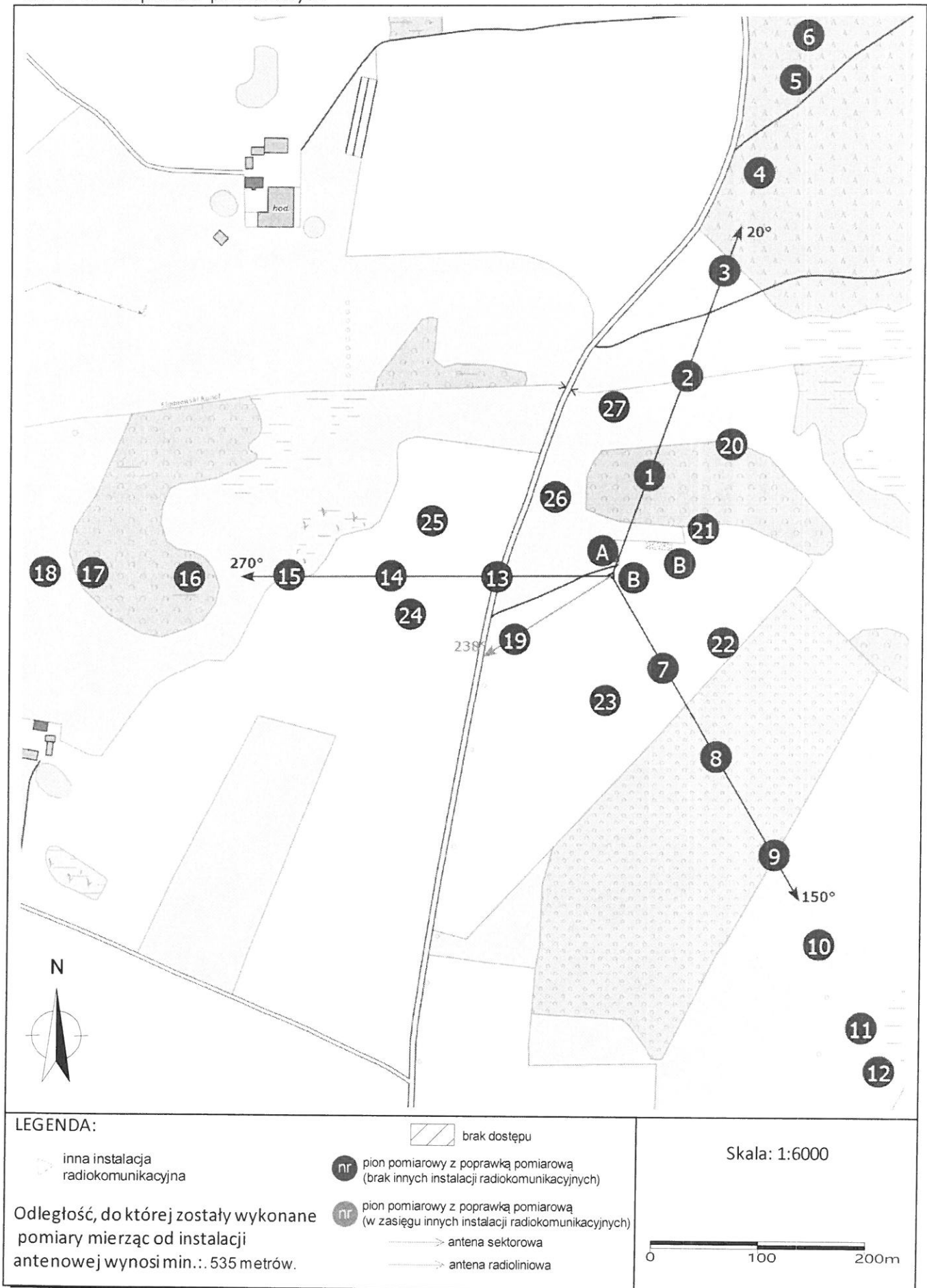
Zał. 2. Widok pionów pomiarowych